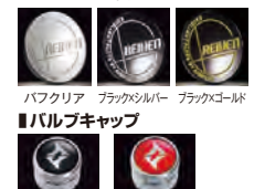
バフクリア ブラックシルバー ブラックゴールド