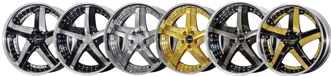
BLACK SCHRITT MACHINING BLACK POLISH SHINING SILVER FINE GOLD TITAN SMOKE POLISH BLACK SCHRITT MACHINING GOLD EDITION

BLACK SCHRITT MACHINING / BLACK POLISH SHINING SILVER / FINE GOLD / GSB BLACK SCHRITT MACHINING GOLD EDITION