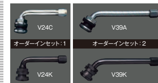
オーダーインセット:1