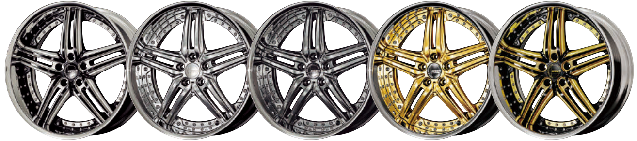
BLACK SCHRITT MACHINING

THE LATEST DESIGN THAT FUSION OF SPIRIT OF INNOVATION AND A DESIGN WEAVES. moreover, an original double pierced earring design serves as leyen's identity, and makes a high-class feeling and presence conspicuous.