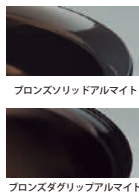
ブロンズソリッドアルマイト