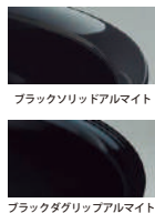
ブラックソリッドアルマイト