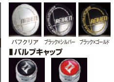
バフクリア ブラックシルバー ブラックゴールド