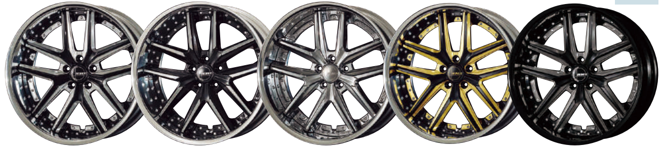
BLACK SCHRITT MACHINING